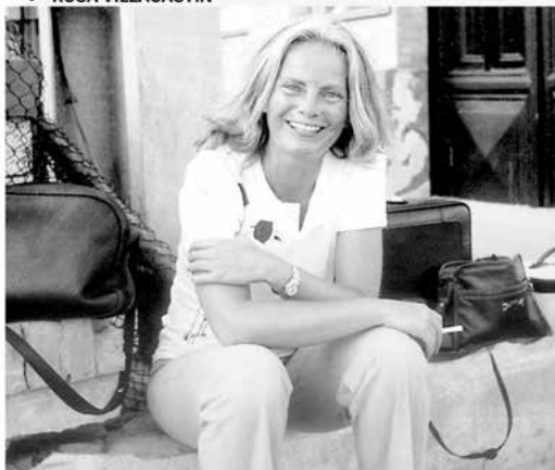
Carmen Díez de Rivera.

En el Instituto Cervantes, organizado por el Círculo Orellana de Madrid, tuvo lugar este martes pasado un merecido homenaje a Carmen Díez de Rivera , a quien conocí en casa de la escritora Carmen Conde -mi madrina y una de las personas que más ha influido en mi vida-, primera mujer académica de la Lengua, con quien mantenía una gran amistad. Fue un encuentro casual, una comida a la que me sumé sin tener idea de quiénes serían el resto de comensales. Mi sorpresa fue mayúscula cuando comprobé que frente a mí se sentaba una de las mujeres más importantes de la Transición . No solo porque era la jefa de Gabinete del presidente Adolfo Suárez , sino porque eran muchas las historias que sobre ella se fueron tejiendo a lo largo de los años. Algunas sin fundamento, otras ciertas por más que ella no hablase nunca